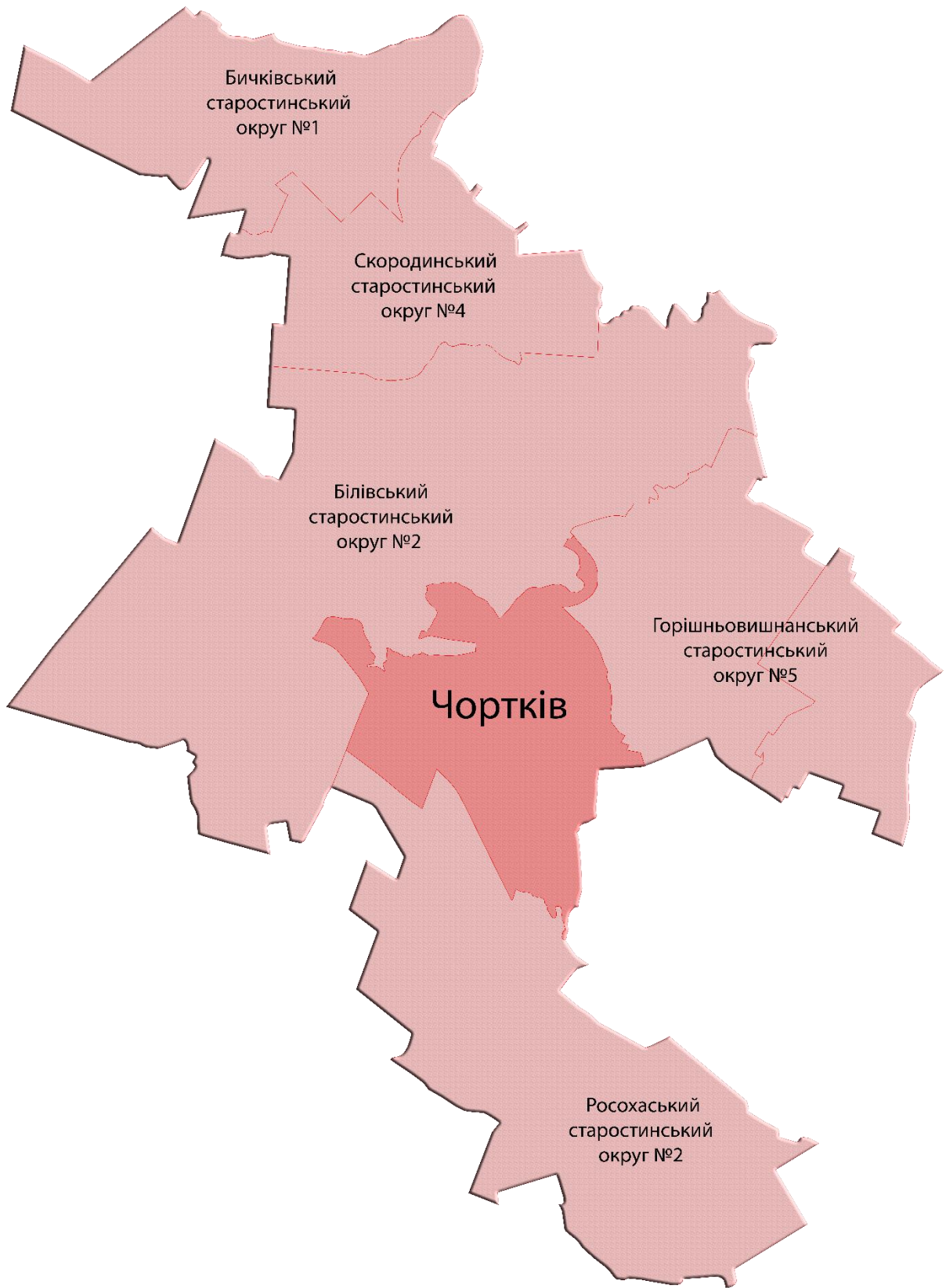
Схема рекламного зонування 2